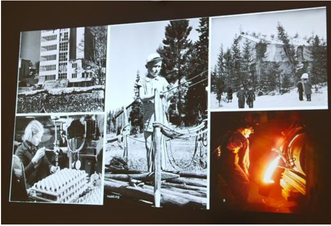
KUVA 6 SODAN JA RAUHAN KESKUS MUISTI, TYÖTURVALLISUUDEN HISTORIAA

jäsenyhdistykset voivat hyödyntää esimerkiksi järjestäessään omia tilaisuuksia tai jäsenet voivat seurata itsenäisesti. Kannustamme kaikkia jäsenyhdistyksiä lisäämään työsuojeluvaltuutettujen ja luottamusmiesten työn näkyvyyttä. Yhdistykset voivat myös kutsua jäseniään tilaisuuteen, jossa luottamusmies ja työsuojeluvaltuutettu tulevat jäsenilleen tutuksi.