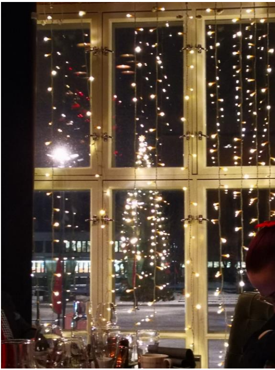
KUVA 8 JOULUKUUSI MIKKELIN TORILLA