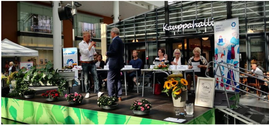
KUVA 9 OAJ ON THE ROAD 2019