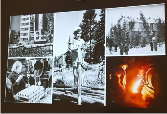
KUVA 6 SODAN JA RAUHAN KESKUS MUISTI, TYÖTURVALLISUUDEN HISTORIAA

jäsenyhdistykset voivat hyödyntää esimerkiksi järjestäessään omia tilaisuuksia tai jäsenet voivat seurata itsenäisesti. Kannustamme kaikkia jäsenyhdistyksiä lisäämään työsuojeluvaltuutettujen ja luottamusmiesten työn näkyvyyttä. Yhdistykset voivat myös kutsua jäseniään tilaisuuteen, jossa luottamusmies ja työsuojeluvaltuutettu tulevat jäsenilleen tutuksi.