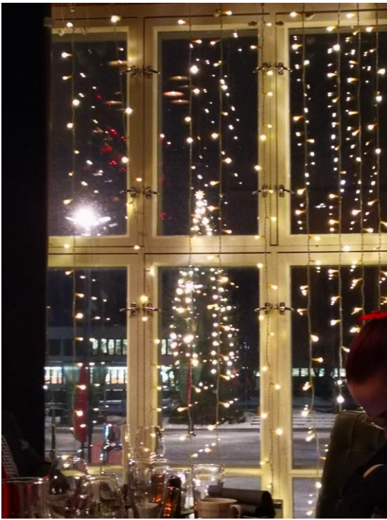
KUVA 8 JOULUKUUSI MIKKELIN TORILLA