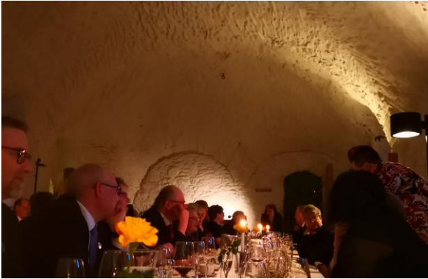
KUVA 11 OAJ ETELÄ-SAVON 12-VUOTISJUHLA OLAVINLINNASSA

Huhtikuussa järjestetään perinteisesti OAJ:n Etelä-Savon alueyhdistyksen sääntömääräinen kevätkokous, johon kutsu lähetetään yhdistyksien kautta kaikille OAJ:n Etelä-Savon alueyhdistyksen jäsenyhdistyksien jäsenille. Totesimme OAJ:n Etelä-Savon hallituksessa, että samalla, kun kutsumme ihmisiä kokoukseen voimme myös järjestää Etelä-Savon opetusalan yhteiset kevätkarkelot.