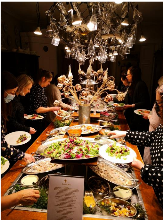
KUVA 7 GLÖGI-ILLAN KATTAUS MIKKELISSÄ

Viikolla 45 vietämme Etelä-Savon opetusalan työturvallisuus ja työsuojeluviikkoa. Järjestämme keskiviikkona 10.11.2022 työsuojeluvaltuutetuille ja luottamusmiehille oman koulutusillan. Torstaina 11.11.2022 tarjoamme turvallisuusteemaisen etäluennon, jota