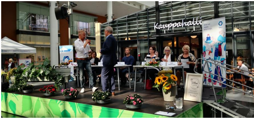
KUVA 9 OAJ ON THE ROAD 2019